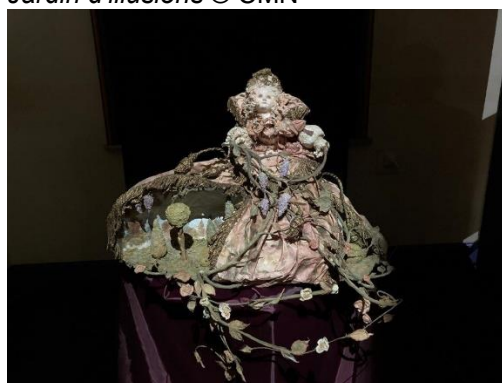
Laetitia Mieral, Jardin d'Armide © CMN