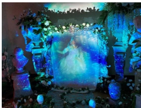
Jardin d'illusions