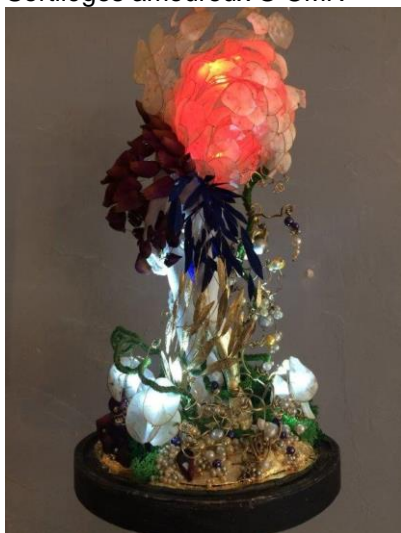
Sébastien Simon, Au cœur du jardin , 2022