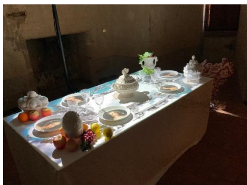
Le banquet merveilleux