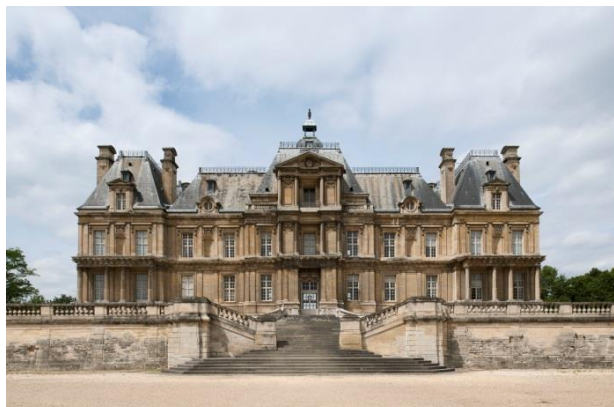
Façade sur jardin du château de Maisons

Depuis sa création, le château de Maisons n'a jamais cessé d'être considéré comme l'une des plus grandes réussites de l'art français. Il est un des exemples le plus raffiné du château classique français. Situé dans les boucles de la Seine, non loin de Saint-Germain-en-Laye, le château de Maisons, construit par François Mansart (1598-1666) dans la première moitié du XVII e siècle pour René de Longueil, président à mortier au parlement de Paris est également considéré comme l'un des grands chefs-d'œuvre de cet immense architecte.