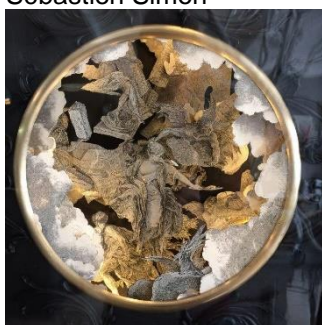
Sébastien Simon, La destruction du palais (détail), 2022 © Sébastien Simon